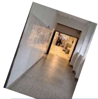
Visite du restaurant scolaire