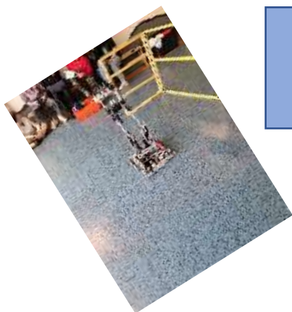
Présentation du club Robot et RE6 (Réussir son entrée en 6 ème ) et des différentes actions mises en place durant les vacances

Chaque enfant a pu découvrir les différents pôles présentés :