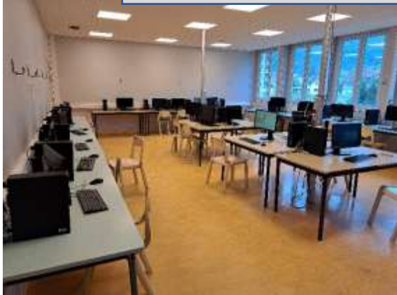
Présentation d'une salle de sciences et du matériel