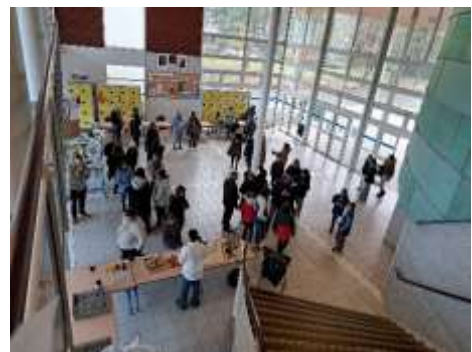
La vie scolaire

Chaque enfant a pu découvrir les différents pôles présentés :