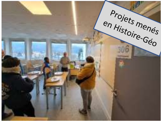
Projets menés en Histoire-Géo